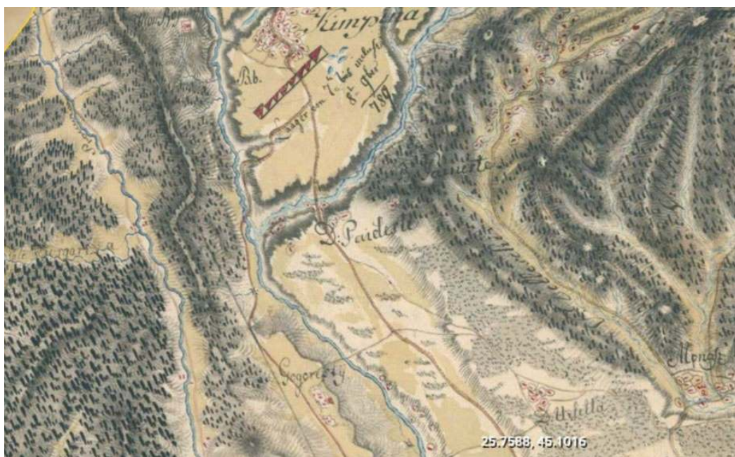
Figura II: Fragment din Harta Valahiei din 1790