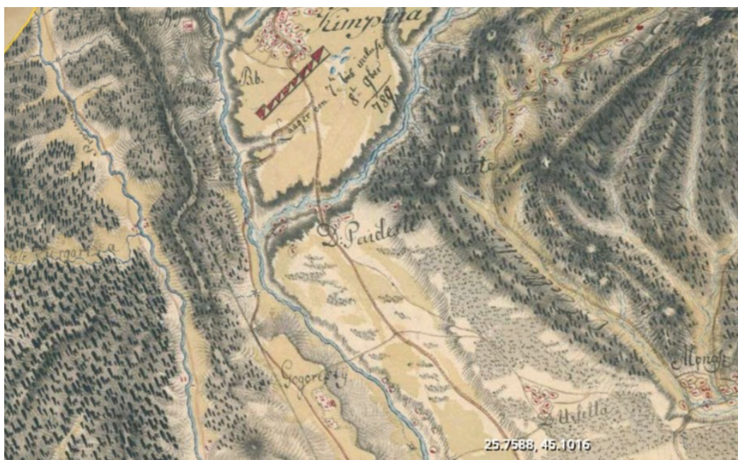
Figura II: Fragment din Harta Valahiei din 1790