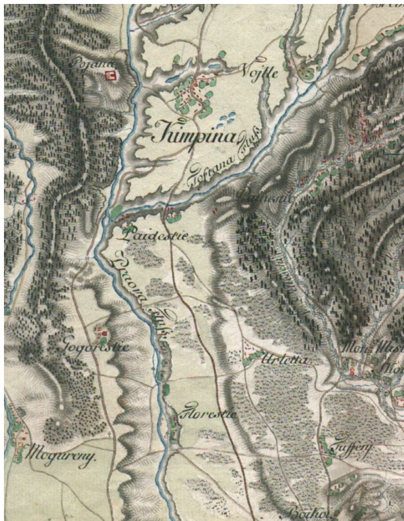
Figura I: Fragmente din Harta Specht 1791