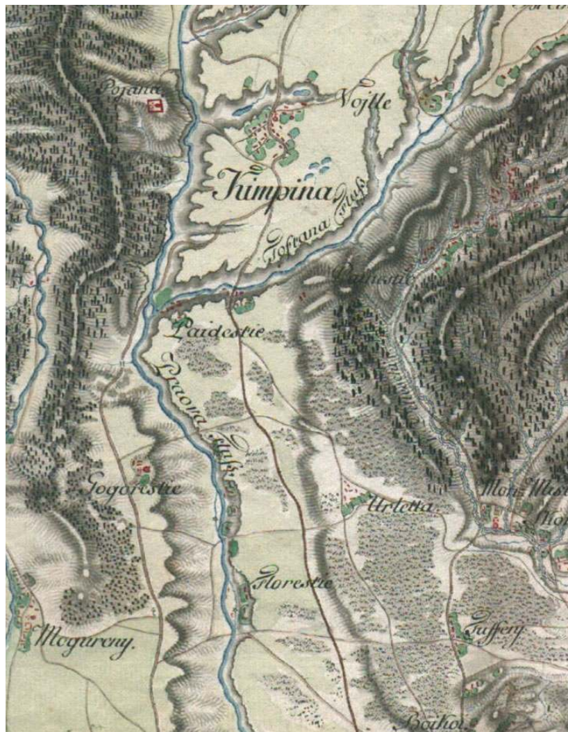
Figura I: Fragmente din Harta Specht 1791, sursa: http://limes-transalutanus.ro/materiale.htm