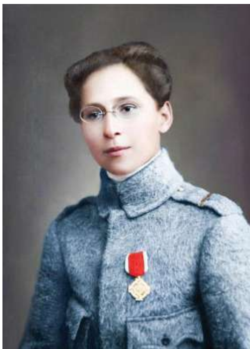
Fig. 1 Ecaterina Teodoroiu (1894-1917)