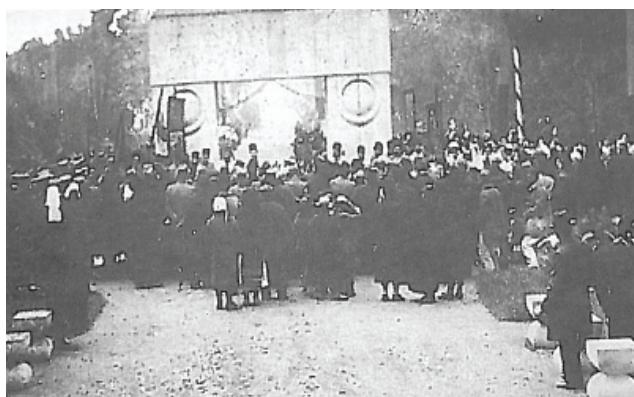
Fig. 2 Ceremonia de sfințire a ansamblului sculptural realizat de către Constantin Brâncuși la Târgu-Jiu.

(Barbu Brezianu, Brâncuși în România , București, Editura BIC ALL, 1998, p. 48)