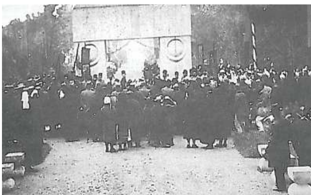
Fig. 2 Ceremonia de sfințire a ansamblului sculptural realizat de către Constantin Brâncuși la Târgu-Jiu. (Barbu Brezianu, Brâncuși în România , București, Editura BIC ALL, 1998, p. 48)