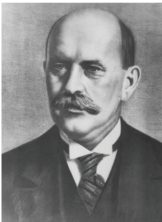
Fig. 3 Matematicianul Gheorghe Țițeica.