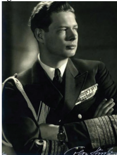
Fig. 7 Regele Mihai I al României.