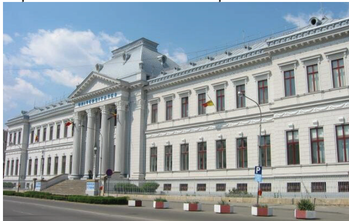
Fig. 6 Universitatea din Craiova.