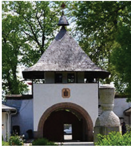
Fig. 5 Foișorul de la Muzeul Viticulturii și Pomiculturii de la Golești.