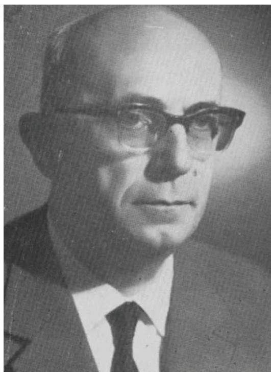
Fig. 4 Istoricul Constantin C. Giurescu.