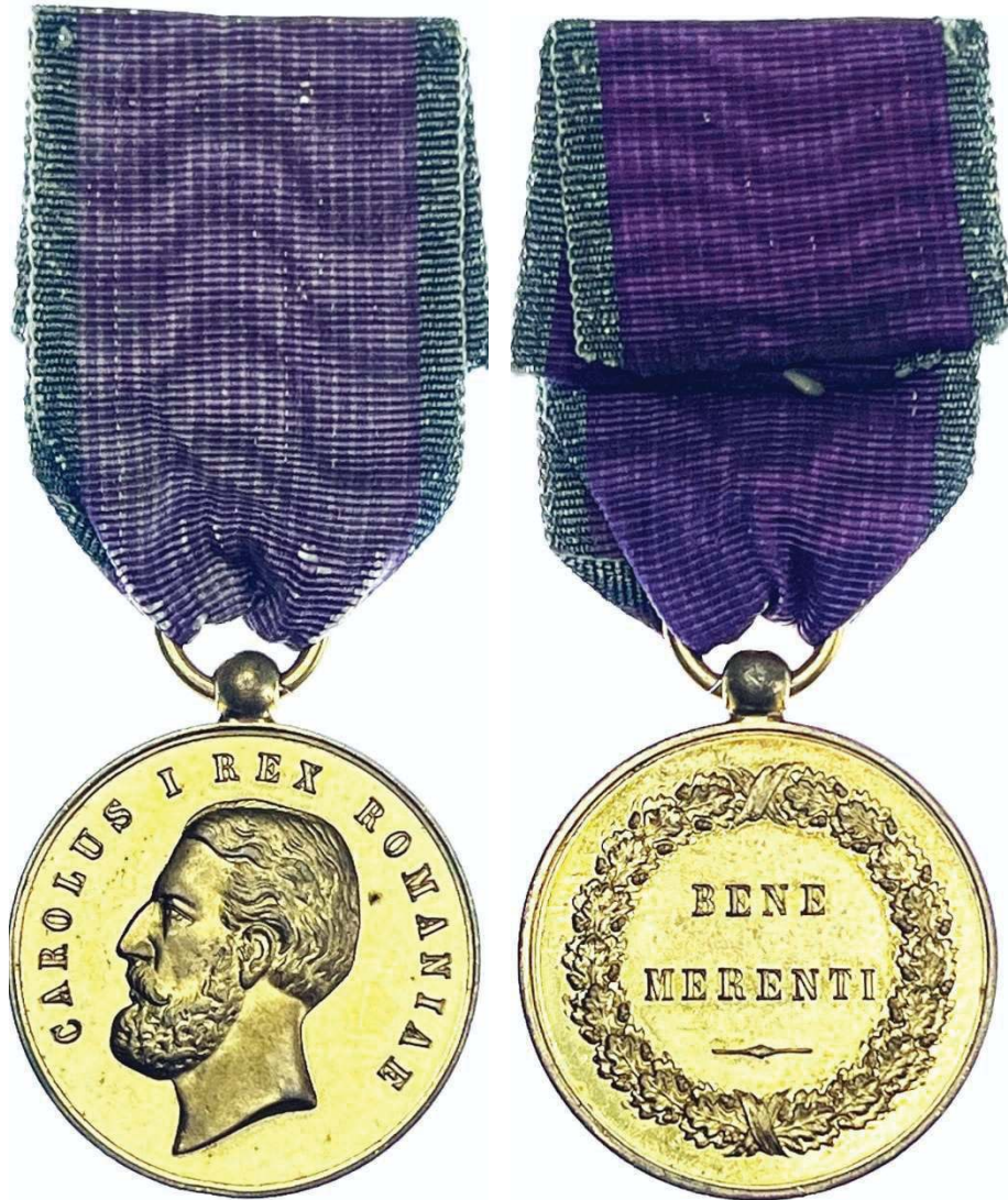
Medalia „Bene Merenti” clasa I (avers și revers).