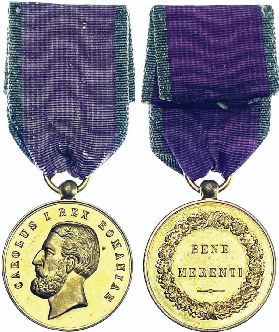
Medalia „Bene Merenti” clasa I (avers și revers).