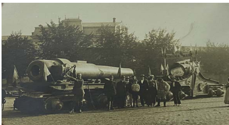
Fig. 5 Piesă de artilerie grea din dotarea armatei SUA