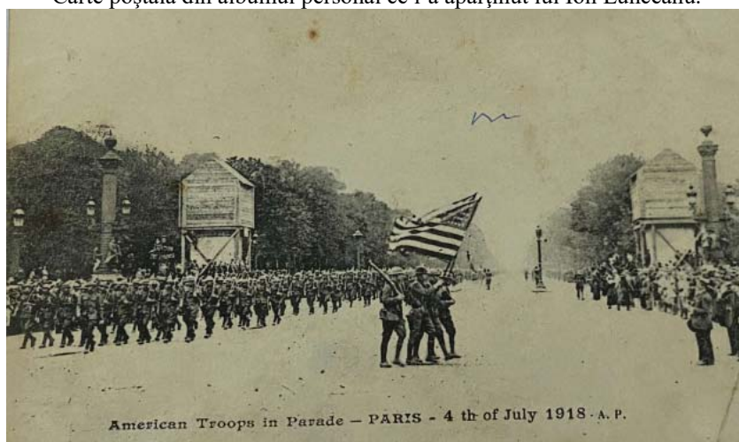
Fig. 10 Parada trupelor americane la Paris (4 iulie 1918). Carte poștală emisă de Crucea Roșie Americană.