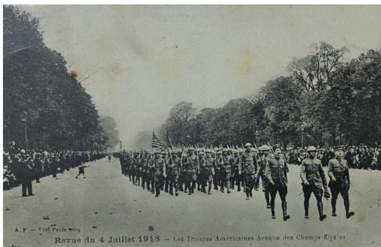
Fig. 8 Trupele americane defilând pe Champs Elysées, Paris (4 iulie 1918). Carte poștală din albumul personal ce i-a aparținut lui Ion Lunceanu.