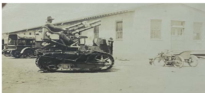
Fig. 2 Ion Lunceanu pe un tun șenilat