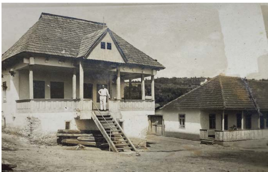
Fig. 19 Ion Lunceanu în prispa casei din comuna Magherești, construită la scurt timp de la revenirea sa din SUA.