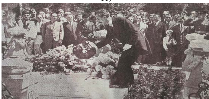
Fig. 17 Depunerea coroanei de lauri a Diviziei a 37-a Infanterie, Ohio, pe mormântul Eroului Necunoscut din București. (Apud Ilie Pârvu, Voluntarii români din America , Sibiu, Editura Krafft&Drotleffs S. A., 1937, p. 19)