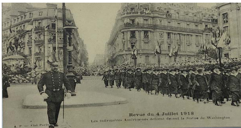
Fig. 9 Infirmiere americane defilând prin fața statuii lui George Washington (Paris, 4 iulie 1918) Carte poștală din albumul personal ce i-a aparținut lui Ion Lunceanu.