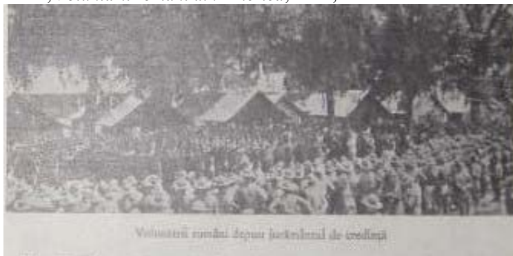
Fig. 15 Voluntari români depun jurământul de credință.

(Apud Ilie I. Pârvu, Voluntarii români din America , Sibiu, Editura Krafft&Drotleff S. A., 1937)