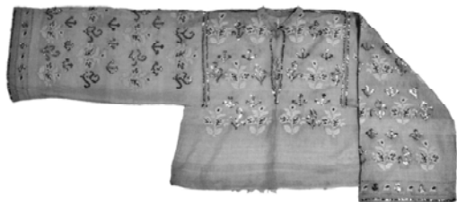
Ie „cu fluturi”, 2/4 sec. XIX, Teleorman, Muzeul Național al Satului „Dimitrie Gusti”, București, inv. 15100

celelalte podoabe descrise în Foaie. Mai mult decât atât, chiar dacă secretarul brâncovenesc Anton-Maria del Chiaro Fiorentino 22 menționează salbele ca podoabe ale româncelor cu siguranță a făcut referire la clasa de mijloc deoarece în nici-un tablou votiv nu am întâlnit ca doamnele de rang să poarte salbe în acea perioadă.