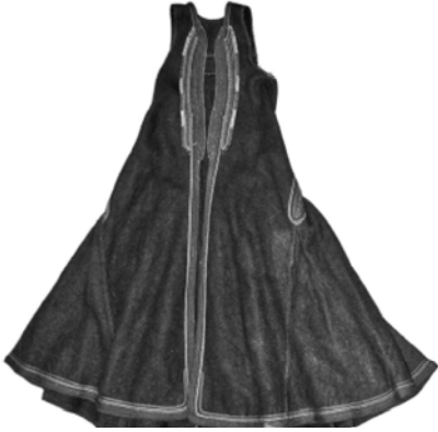
Șigună Muzeul Național al Satului „Dimitrie Gusti”, inv. 10272

Este cunoscut faptul că aceasta este perioada, care va continua până la mijlocul secolului al XVIII-lea, în care femeile vor înlocui brăul și cingătorile metalice, la fel ca și bărbații.