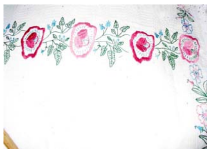
Toluri în „coște”