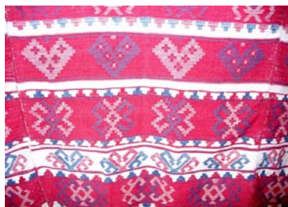
Lepedeu confecționat din pânză industrială.