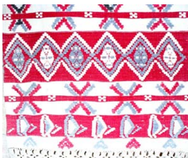
Ștergare de rudă de rudă datate la începutul secolului al XX-lea