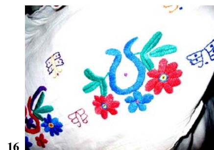
Perne aparținând celei de a doua jumătăți a secolului al XX-lea confecționate pe pânză industrială.