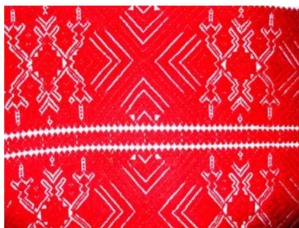
Perdele realizate în tehnica broderiei pe fire trase