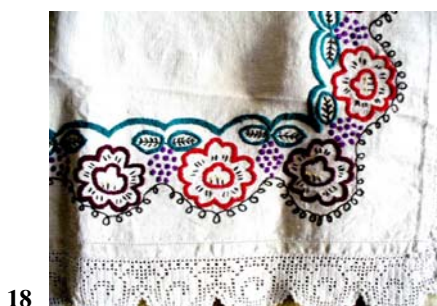
Fata de masă de la începutul sec. XX