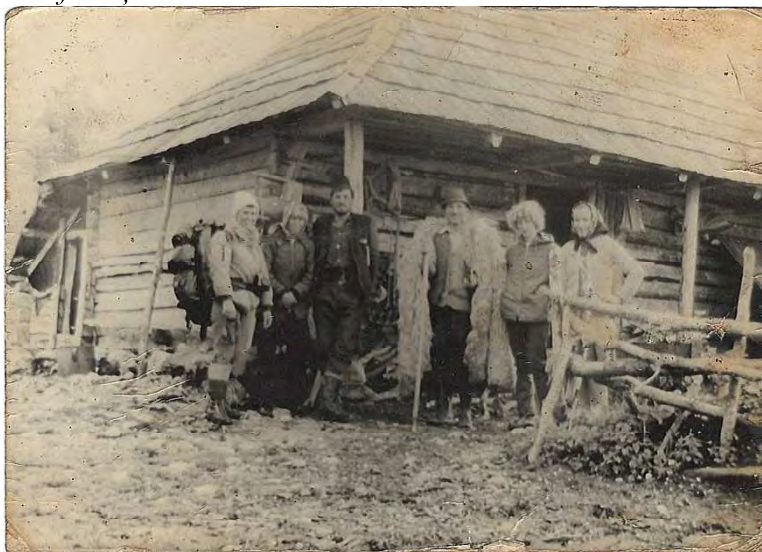
La stâna din Bulzu

În muntele Bulzu, aproape de cele trei biserici, am fost și eu înainte de a scrie lucrarea despre ungureni din satele Bratilov și Titerlești. Îmi amintesc poteca adâncită, parcă cicatrizată în carnea muntelui, de urmele atâtor animale care au străbătut-o, căci pe acolo treceau atât „potecile oii”,cât și „potecile sării” prin care se făcea legătura cu frătuții .