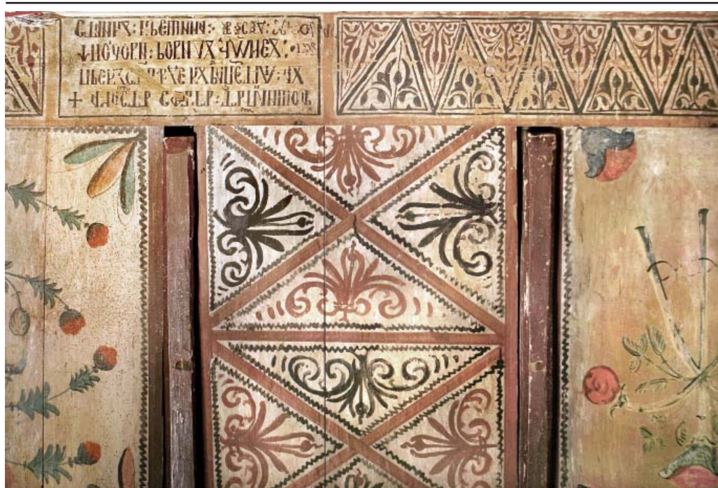
BISERICA DIN PESTISANI DETALIU PICTURA PRONAOS