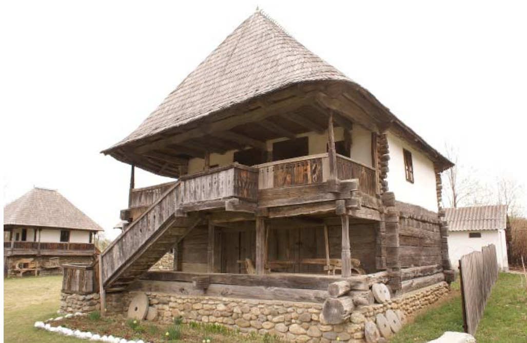
CASA COLTESCU MUZEUL CURTISOARA