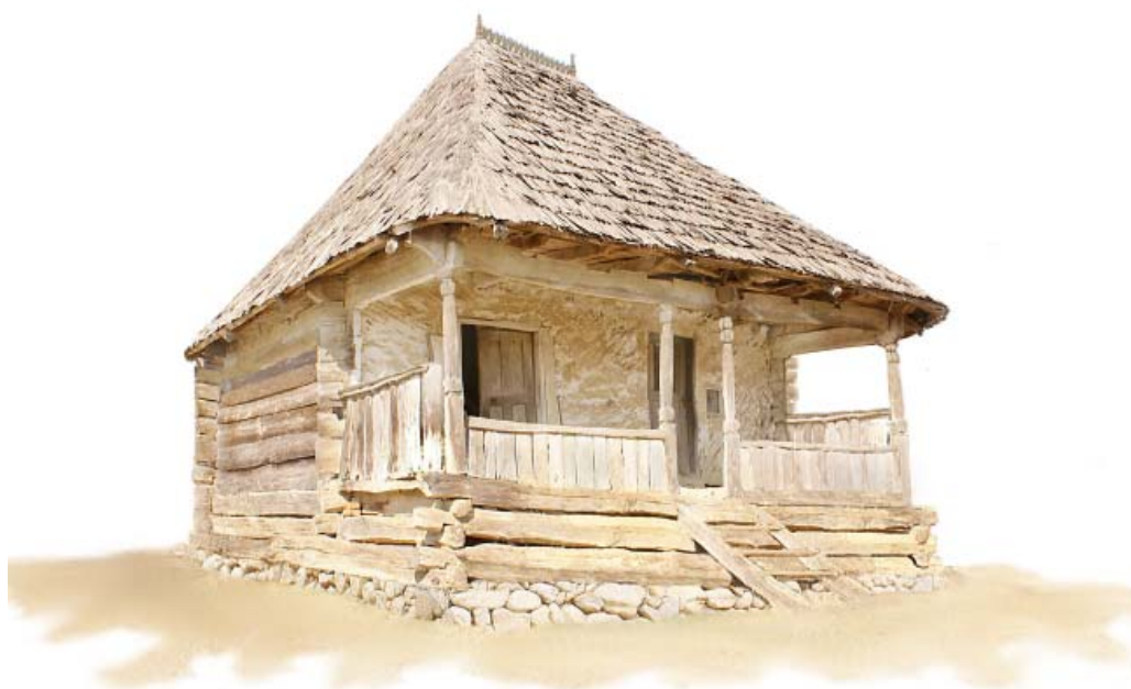
PERSPECTIVA CASA BUMBESTI - PITIC arh CRISTIAN NANU