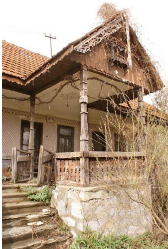
PRIDVOR CASA ARCANI