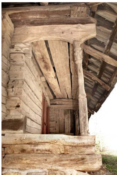
DETALIU PIMNITA BOTA