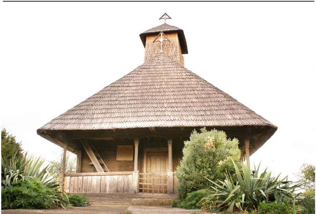
BISERICA DIN PESTISANI