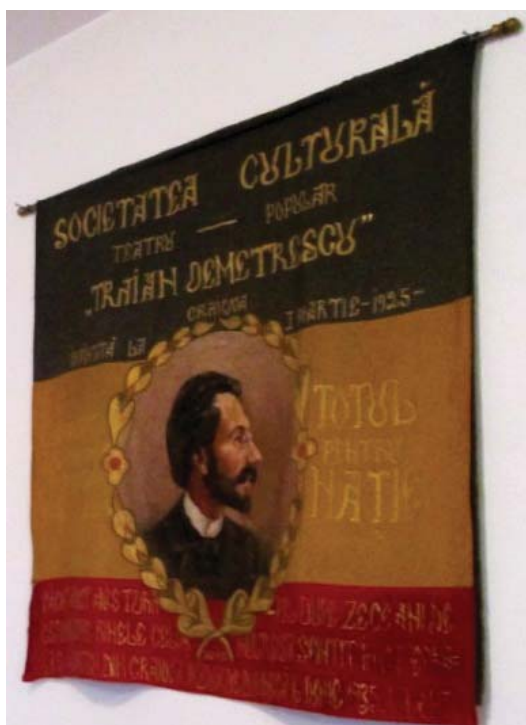
Foto 3 Drapel având în mijloc chipul poetului Traian Demetrescu