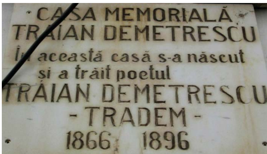
Foto 2 Placa comemorativă amplasată pe casa memorială "Traian Demetrescu"