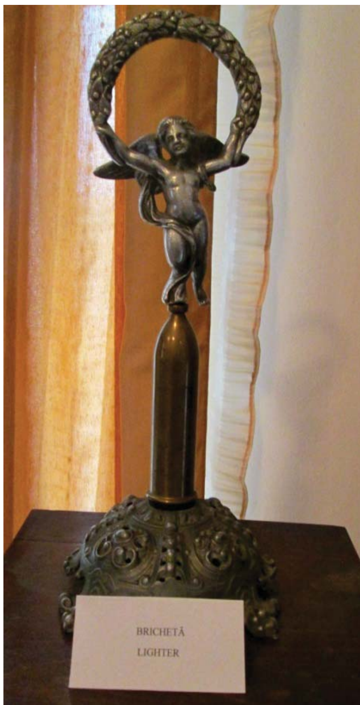
Foto 5 Brichetă expusă în casa memorială "Traian Demetrescu " din Craiova