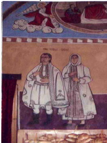
Foto 1. Ctitori ai bisericii cu hramul „Sfinții Voievozi Mihail și Gavril“ din Pocruia, sfințită în anul 1860.

Urzeala se monta pe război, se țesea și se obținea pânza de in mai fină, mai moale și de cânepă mai aspră. Din pânza aceasta se confecționau costumele de vară pentru femei și pentru bărbați.