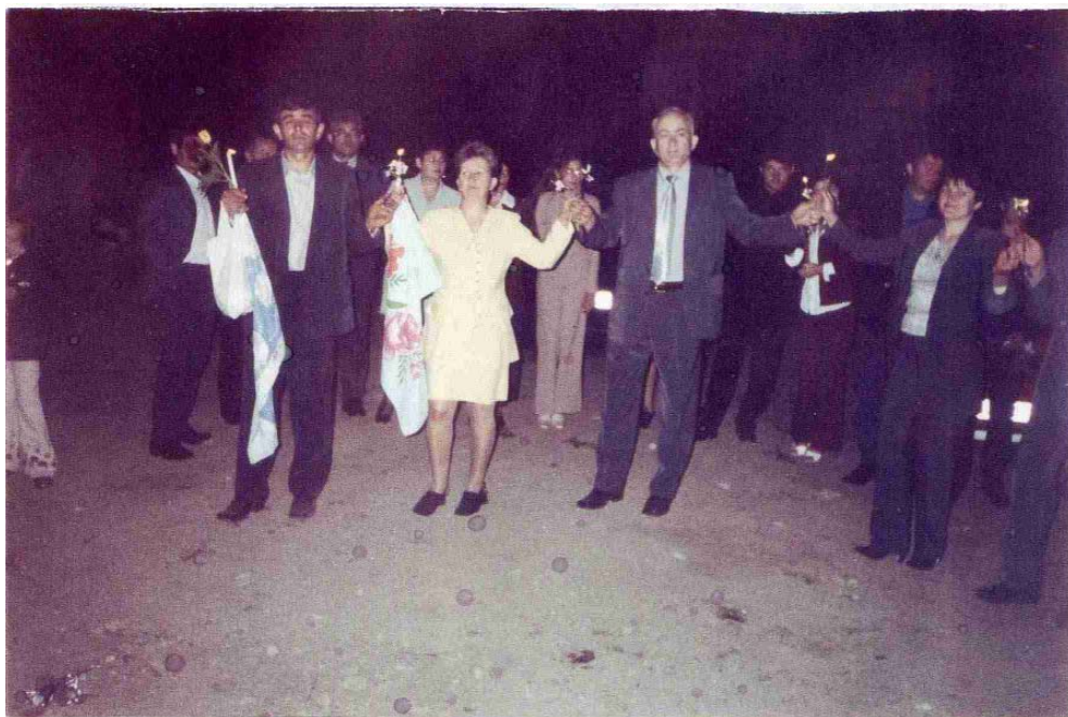
Foto 12. Hore de pomană din ziua de Paști, 2002.