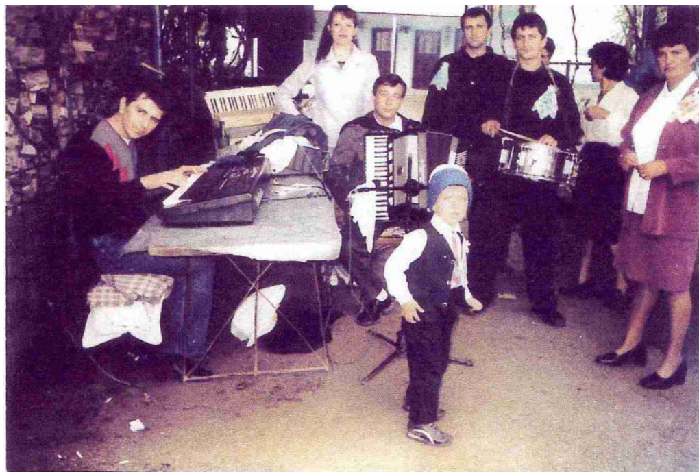
Foto 13. Orchestră modernă din satul Pocruia.