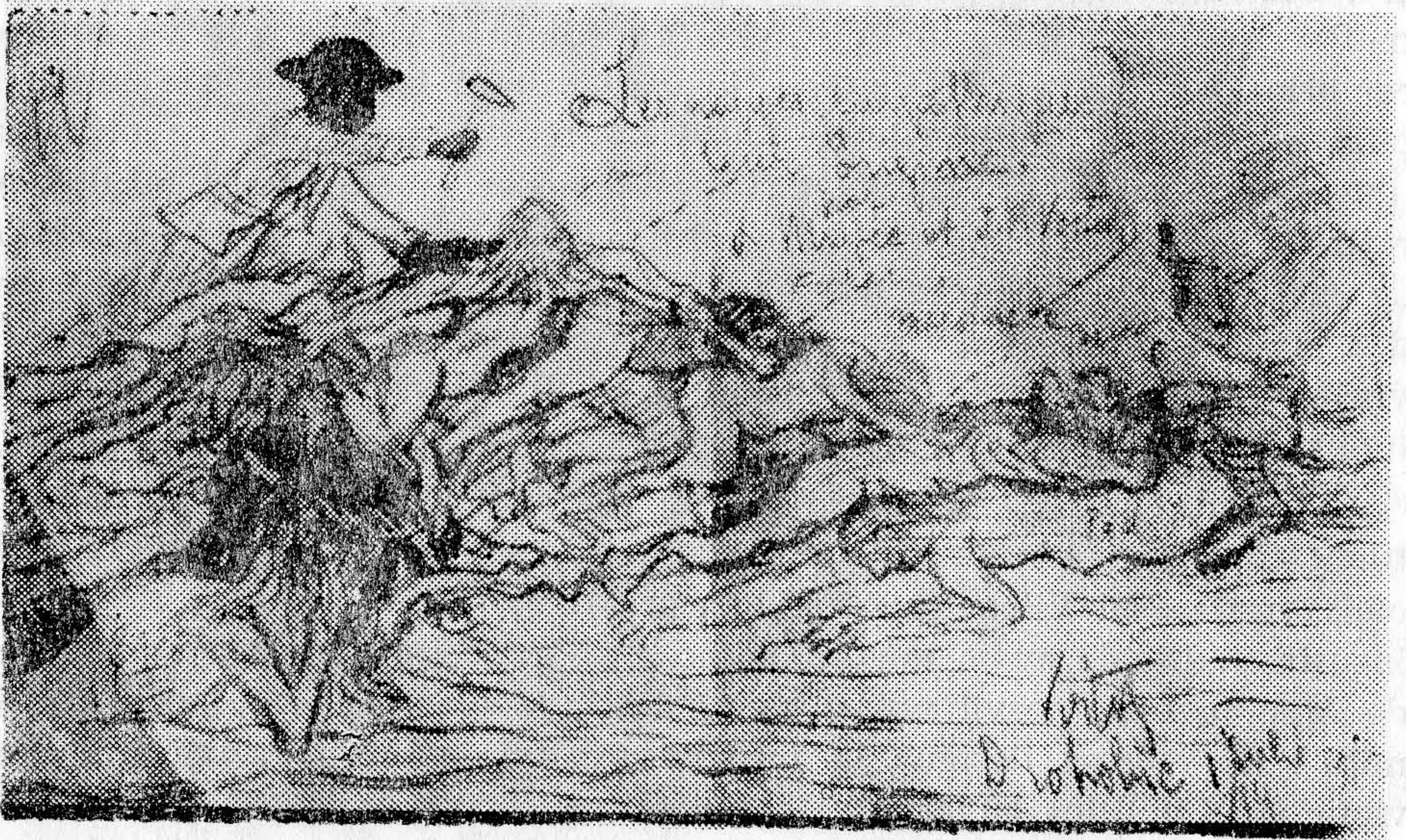
Desen de I. Popescu-Voitești