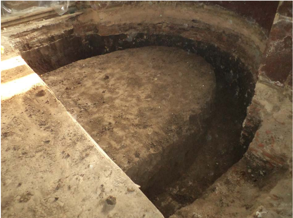
Aspect de săpătură arheologică preventivă