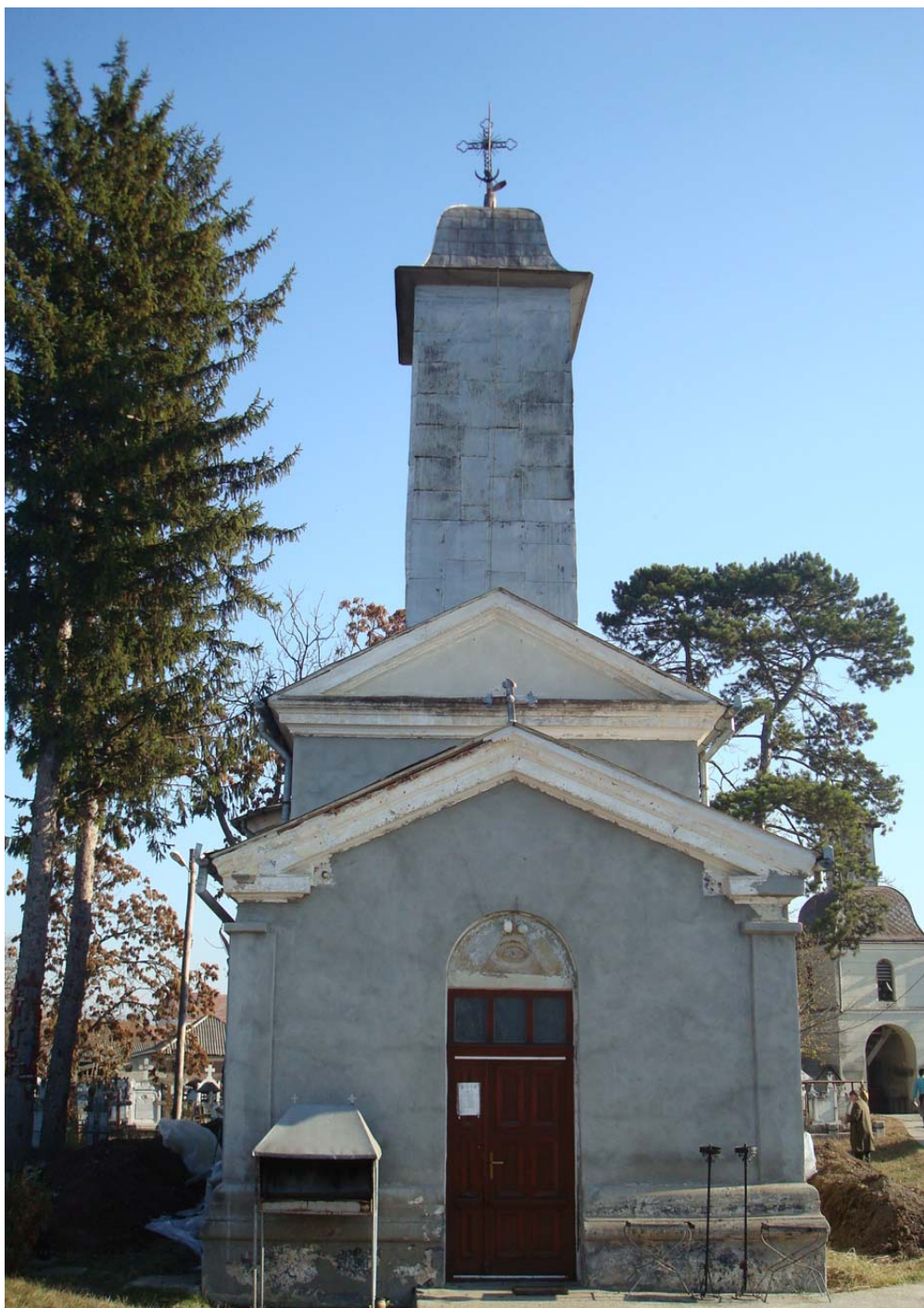
Vedere generală. Biserica „Sfinții Voievozi”.