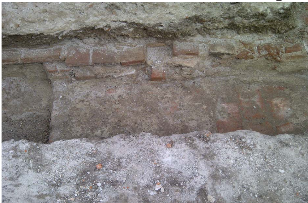
Aspect de săpătură arheologică preventivă