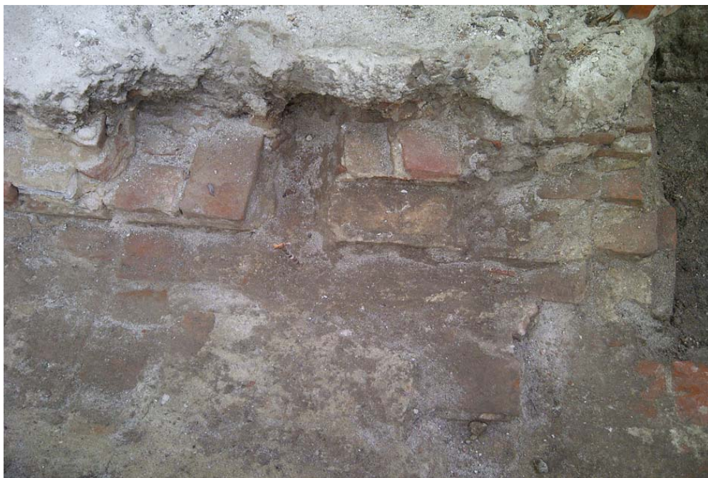
Aspect de săpătură arheologică preventivă