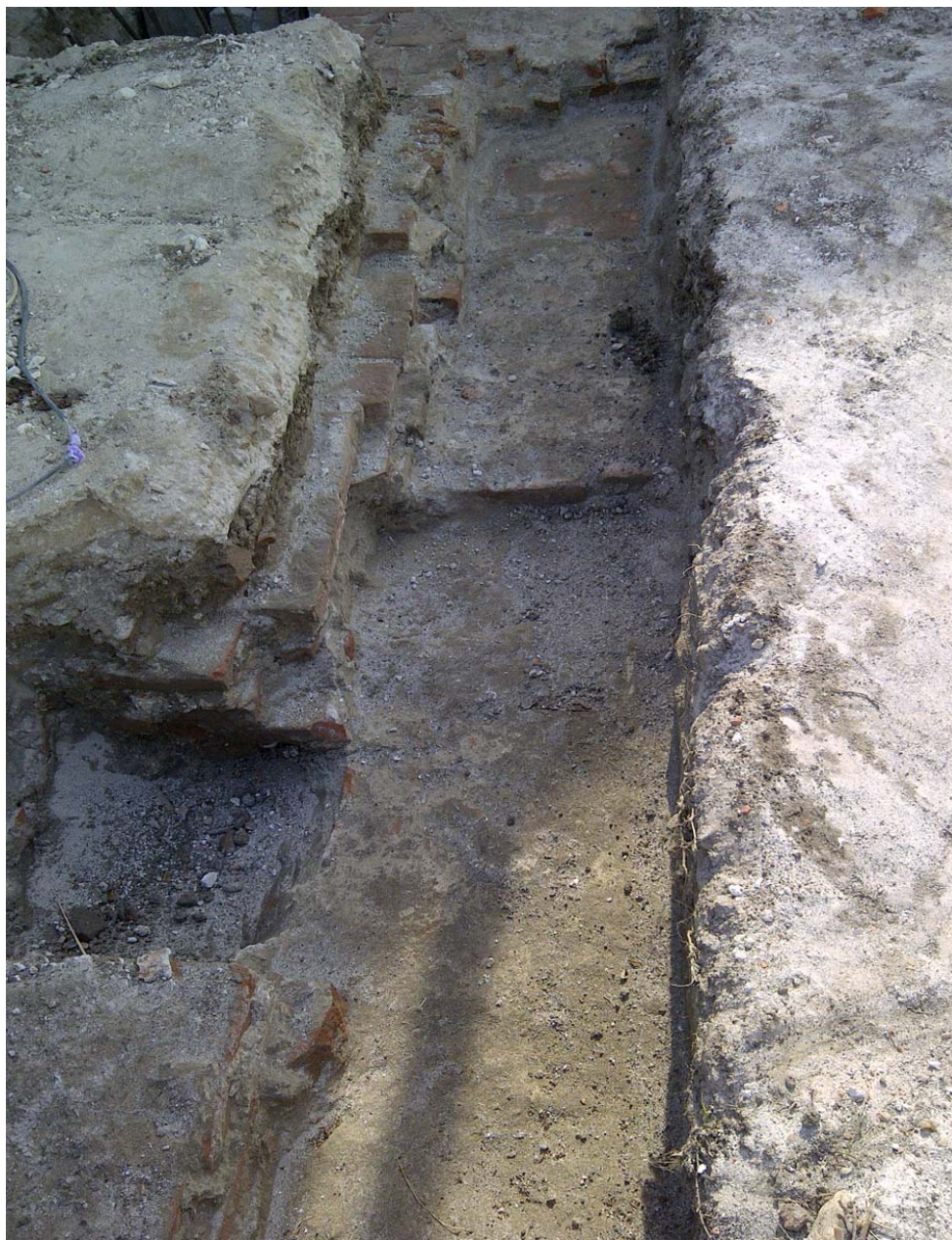
Aspect de săpătură arheologică preventivă