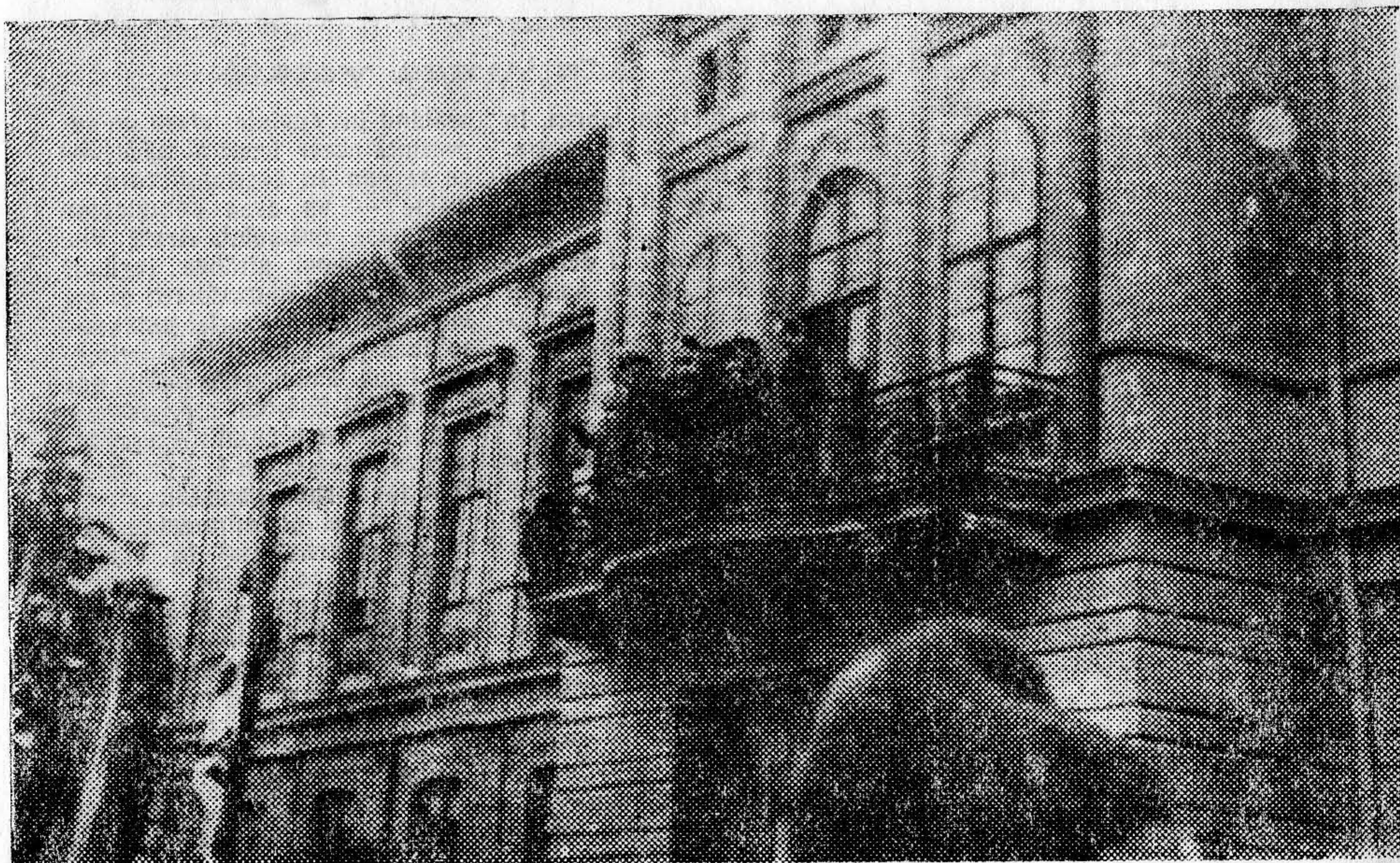
La balconul prefecturii Gorj a apărut noul prefect democrat, la 3 martie 1945.