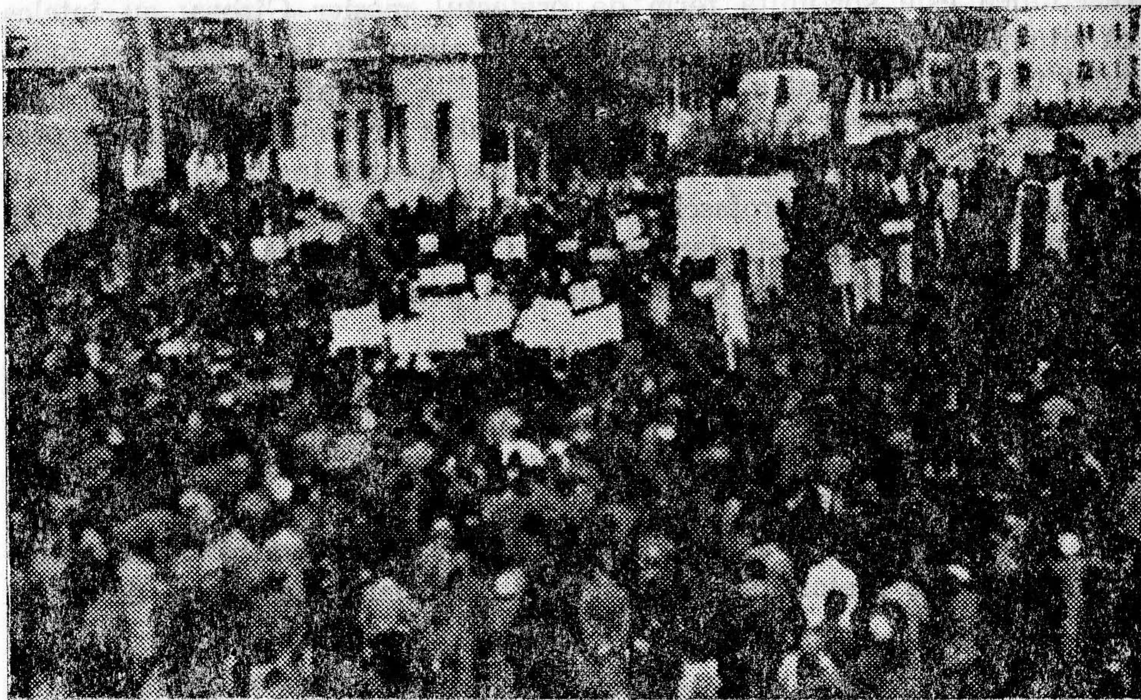
Marea demonstrație a populației gorjene, la Tîrgu-Jiu, din februarie 1945, pentru un guvern al F.N.D.

rani și muncitori lapte, ouă, lână, cereale, fără a le da nici un ban. Aceștia erau scoși la tot felul de rechiziții și corvezi, în timp ce chiburii nu erau întrebați de nimic.