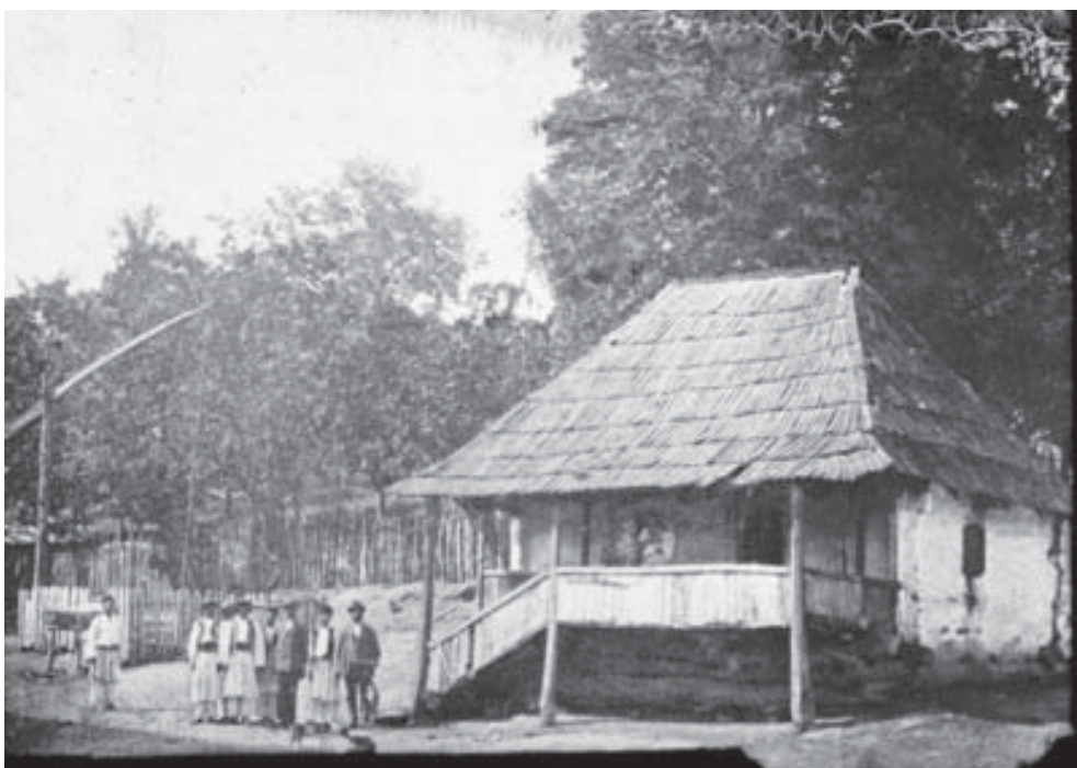
Fig. 3 Casa din Valea Deșului, comuna Vladimir, unde s-a născut Tudor Vladimirescu.