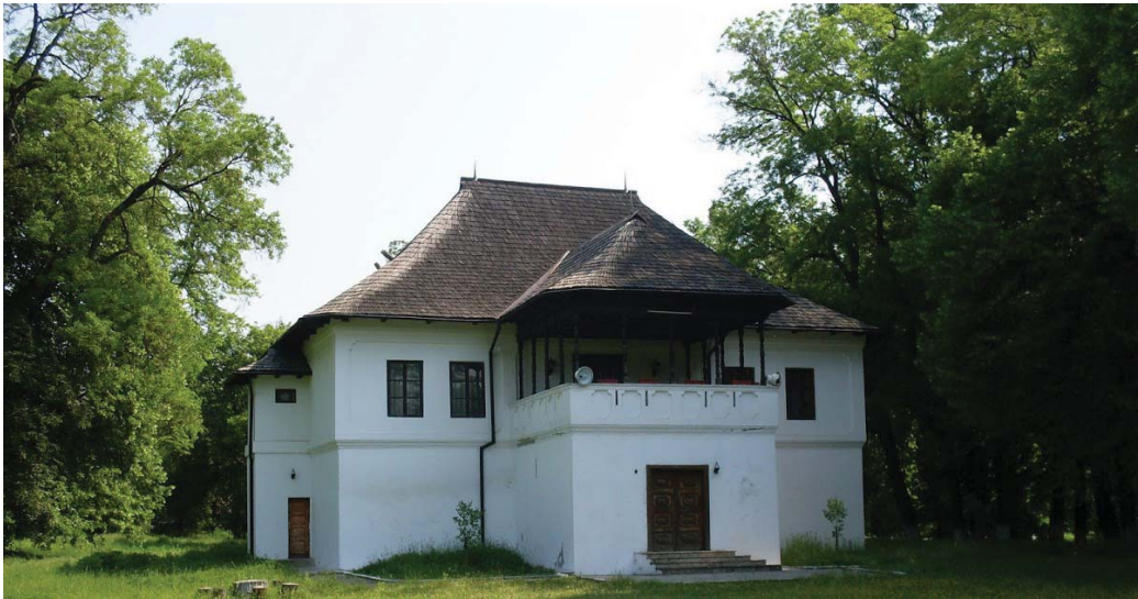
Fig. 10 Cula Glogoveanu de la Glogova.