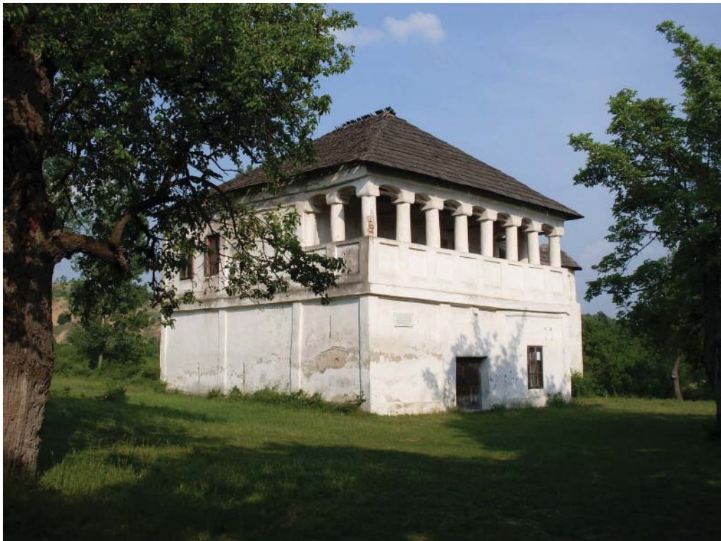
Fig. 11 Cula lui Tudor Vladimirescu de la Cerneți, jud. Mehedinți.