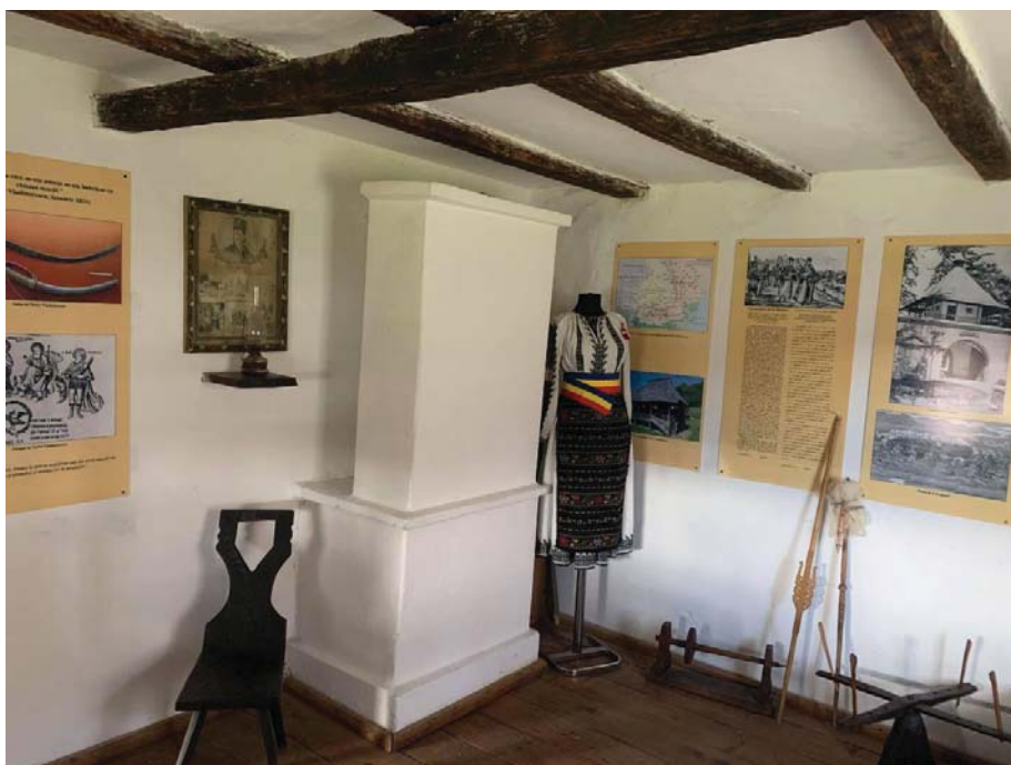
Fig. 12 Interiorul uneia dintre cele două camere ale casei memoriale „Tudor Vladimirescu“ din Vladimir.