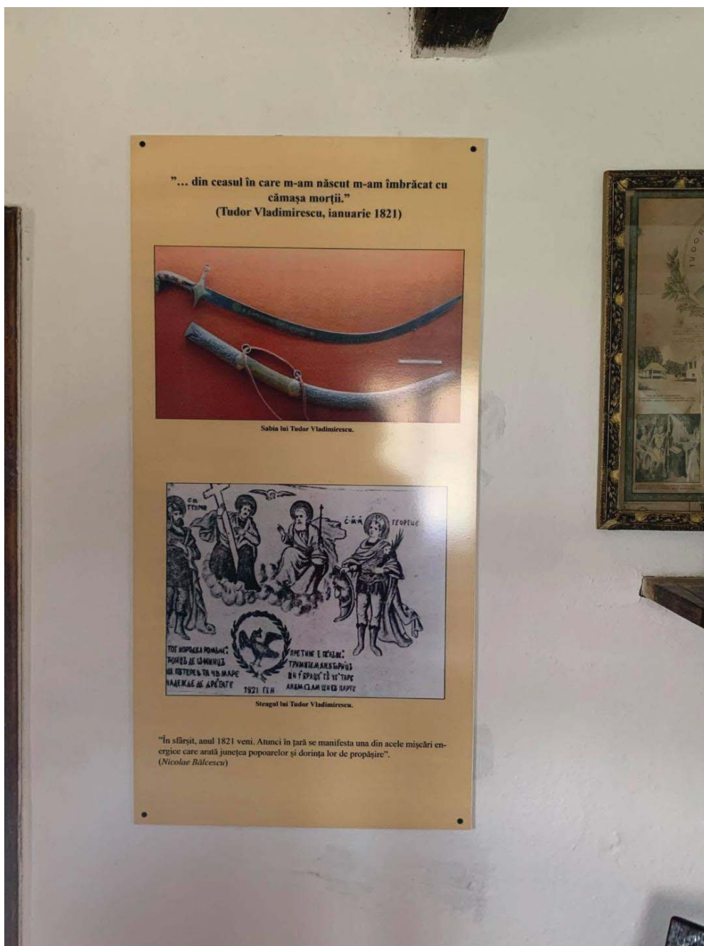
Fig. 15 Aspect din cadrul expoziției permanente a casei memoriale „Tudor Vladimirescu“ din comuna Vladimir.