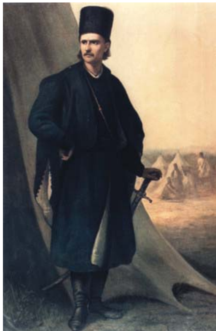
Fig. 1 Portretul lui Tudor Vladimirescu realizat de către pictorul craiovean Theodor Aman. O reproducere a acestui portret este expusă în cadrul expoziției permanente a Secției de Arheologie-Istorie a Muzeului Județean Gorj „Alexandru Ștefulescu“ din Târgu-Jiu.