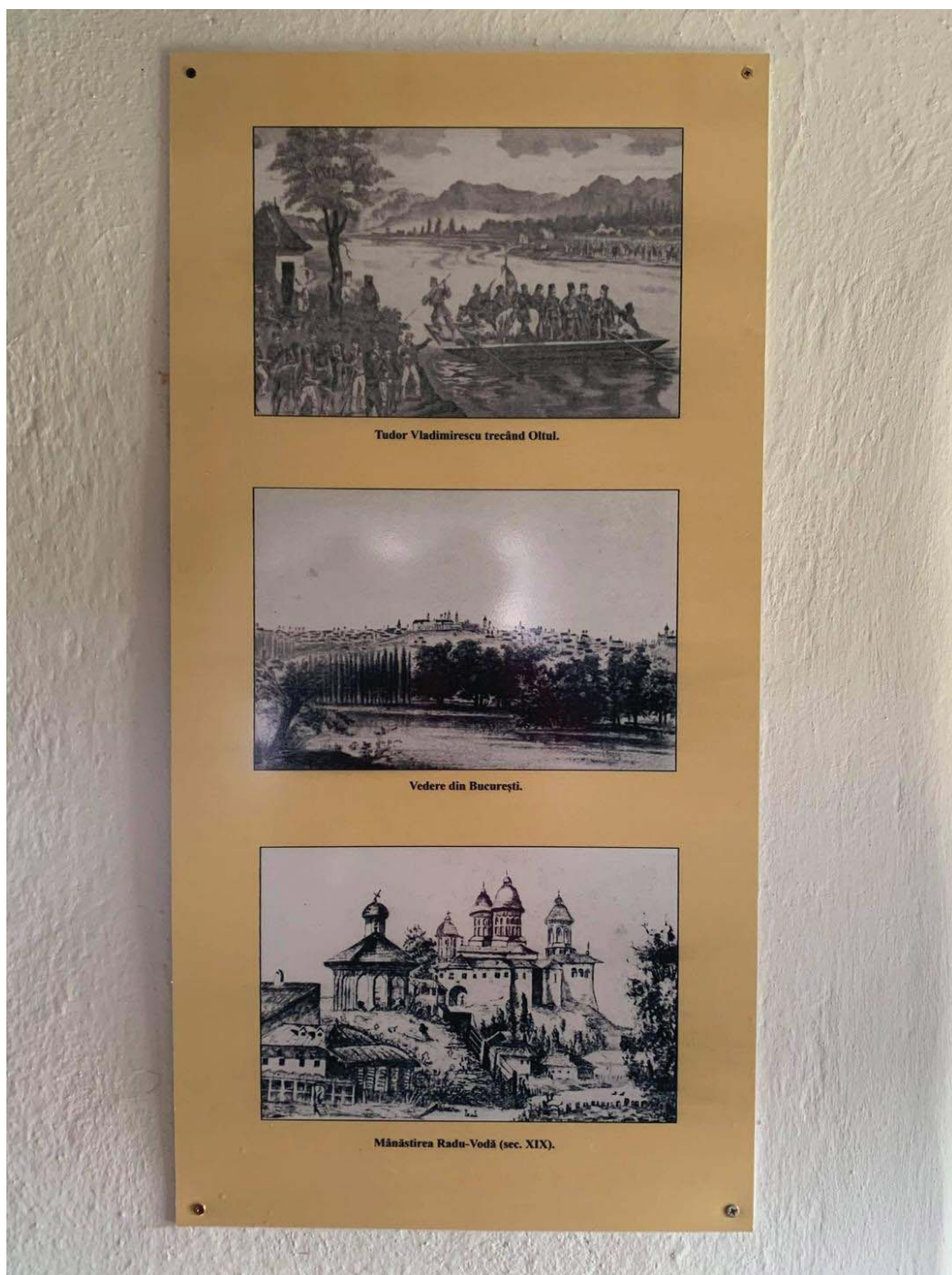
Fig. 14 Aspect din cadrul expoziției permanente a casei memoriale „ Tudor Vladimirescu “ din comuna Vladimir.