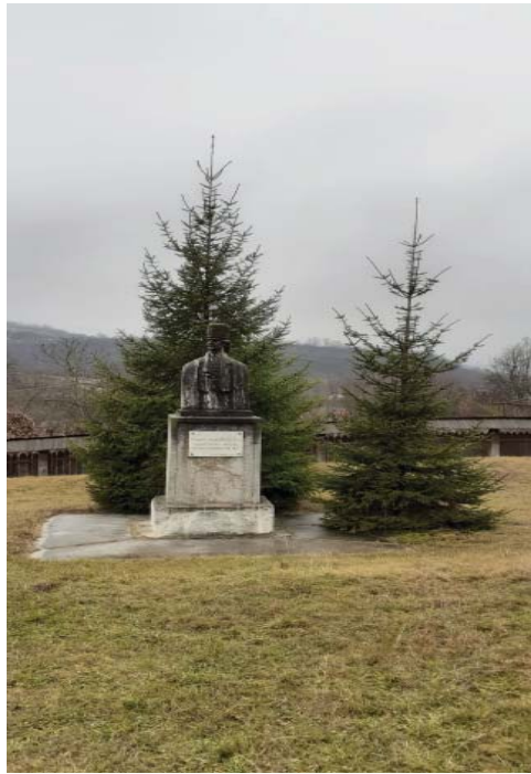
Fig. 5 Bustul lui Tudor Vladimirescu amplasat în curtea casei memoriale de la Vladimir, realizat de către sculptorul gorjean Vasile Blendea.