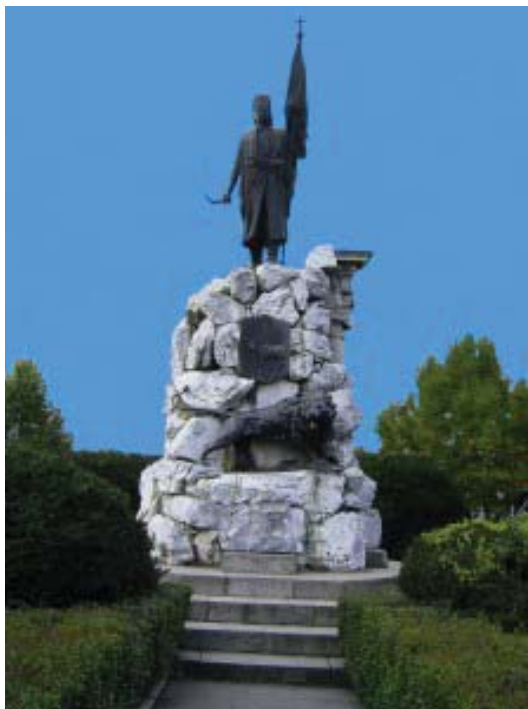
Fig. 6 Statuia lui Tudor Vladimirescu, realizată de către sculptorul gorjean Constantin Bălăcescu, amplasată în centrul oraşului Târgu-Jiu în 1898.