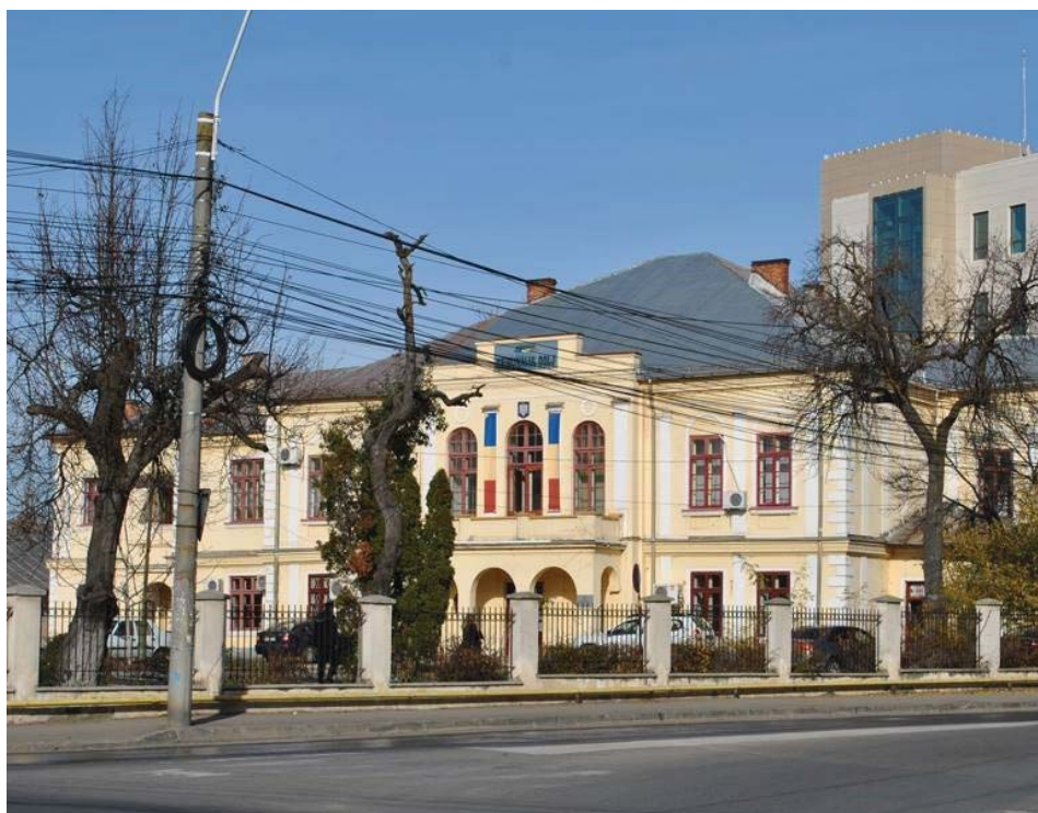
Fig. 7 Casa deținută de familia Glogoveanu în Craiova, actualmente sediu al Tribunalului Dolj.