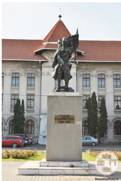
Fig. 8 Statuia lui Tudor Vladimirescu din Craiova.