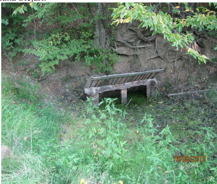
Fântână veche, la confluența pârâului Amărăzuia cu afluentul Ivancu

1968. Comuna Piscoiu a fost desființată, iar cele două sate au fost incluse în noua comună Stejari.