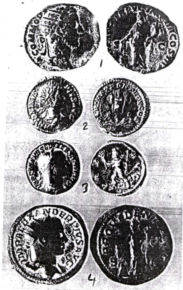
Planșa I: Monede provenind de la Preajba Mare, Târgu Jiu, județul Gorj.