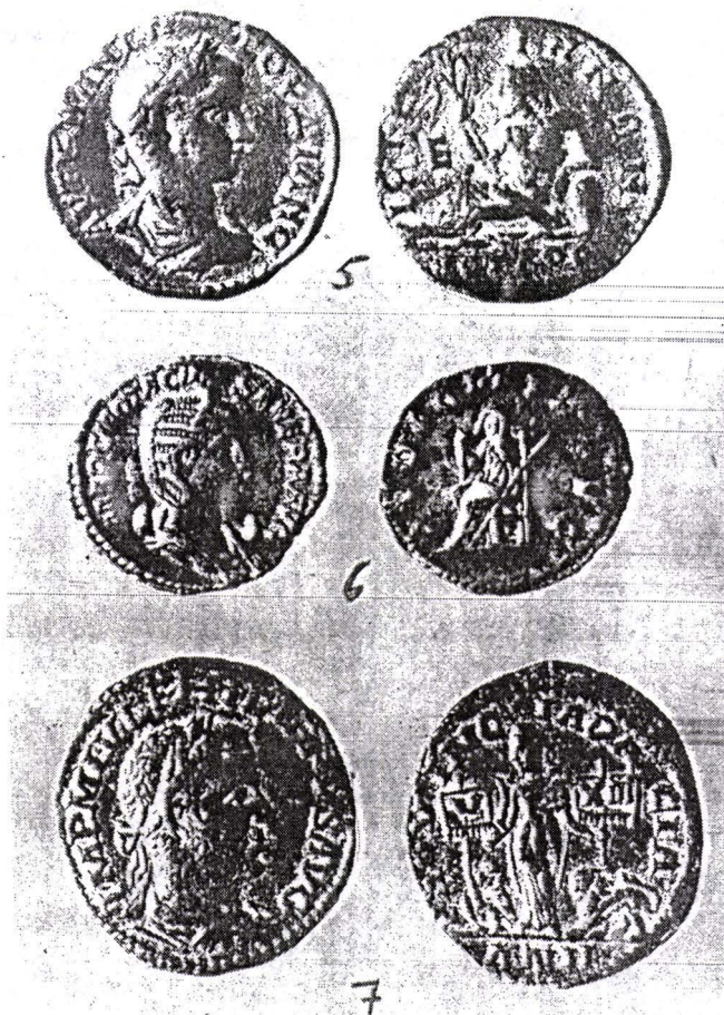
Planșa II: Monede provenind de la Preajba Mare, Târgu Jiu, județul Gorj.