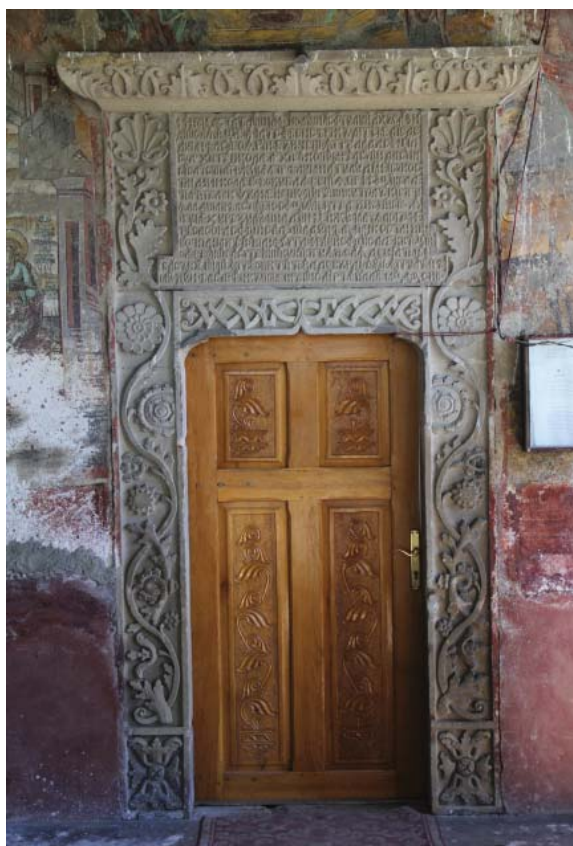
3. Pisania și ancadramentul sculptat în piatră al bisericii din Telești.