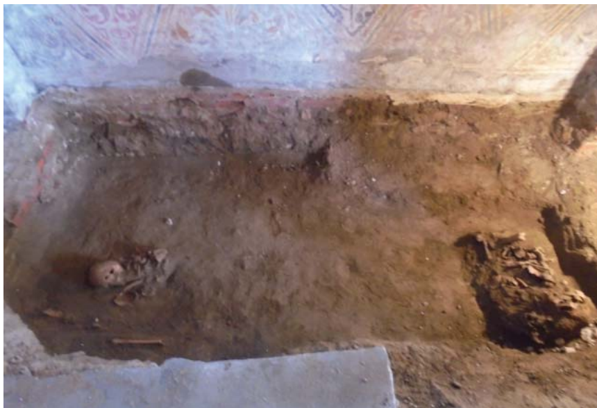
5. Caseta din zona de sud a pronaosului. Cripta cu osemintele lui Fota căpitan Bălăcescu, ale soției sale Stanca și ale fiului lor Ioan.

În caseta executată în sudul pronaosului (dimensiuni 3,2 x 2,4 m) s-a descoperit o criptă cu oseminte umane, aparținând probabil celor trei personaje amintite în inscripția pietrei tombale, precum și a unui urmaș al acestora. Toate osemintele erau deranjate, în urma unor intervenții din secolele trecute, iar osemintele au fost grupate în diferite zone ale criptei. Cripta a fost zidită, cu cărămidă de epocă, încă de la jumătatea secolului al – XVIII-lea.