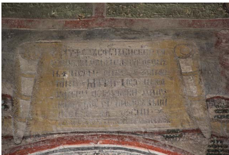
2. Pomelnicul zugravilor bisericii din Telești.